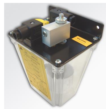
Kleines Leitungssystem 33V