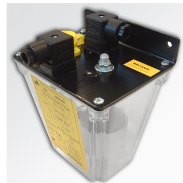
Piccola Einzelleitungssystem (01)

Die Pumpe liefert kontinuierlich das Schmierfett aber bei Bedarf kann sie mit einer entsprechenden Schaltungsausstattung ausgestattet werden, die die Lieferung des Öls in regelmäßigen Zeitintervallen gemäß den Bedürfnissen der Maschine ermöglicht.